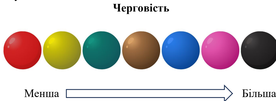
Рисунок 2 – Черговість кольорових куль